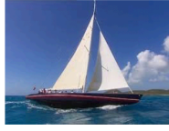
Tour en bateau à voile