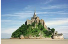
Visite de Chateau-sur-île