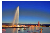
Jet d'eau de Genève