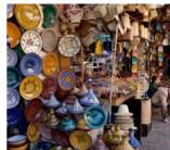
Marchés (« souks »)