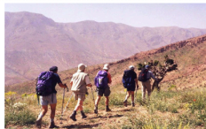
Randonnée en montagne