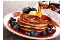
Crêpes au sirop d'érable