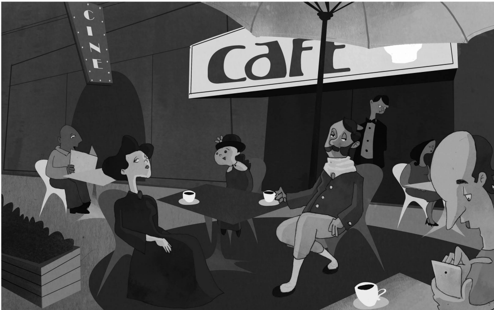
El portal de calle Huérfanos