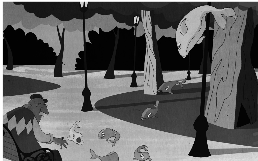
Extraño tipo de pájaro aparece en el Parque Forestal