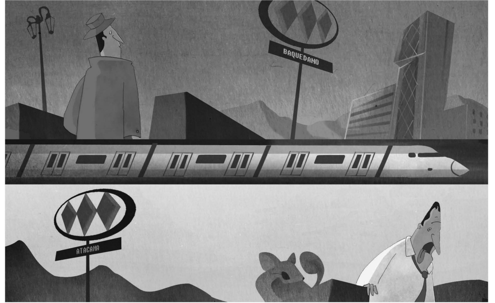
El Metro del futuro