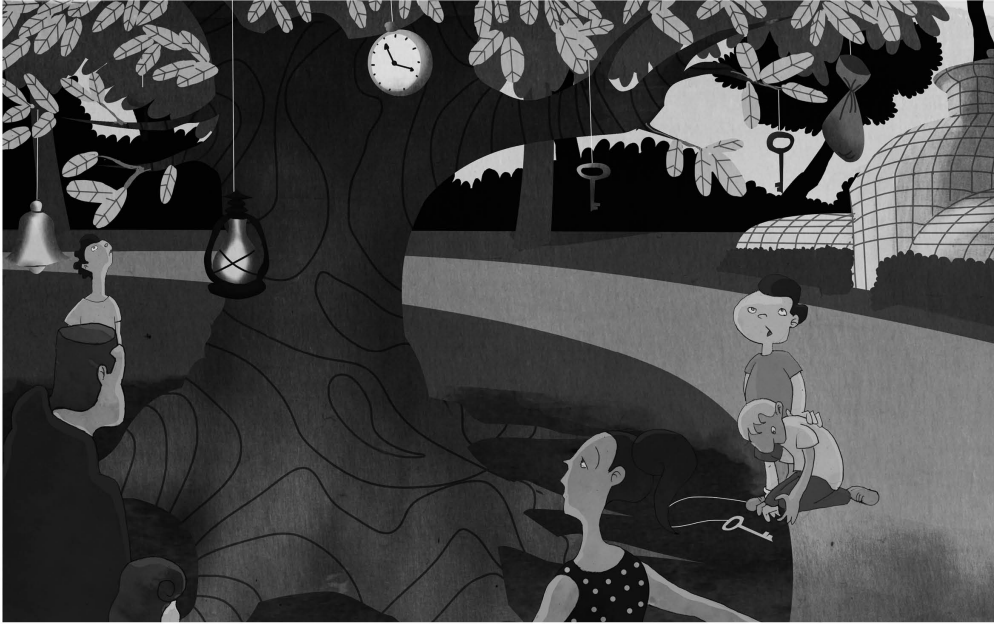
El árbol maravilloso de la Quinta Normal