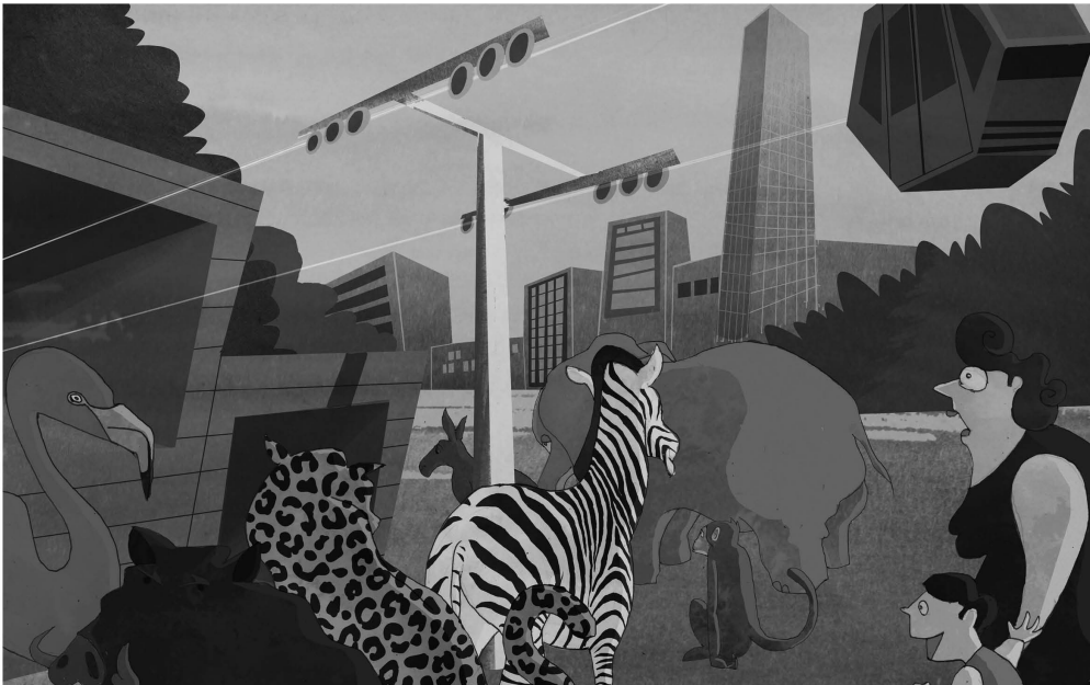
¡Teleférico para todos!