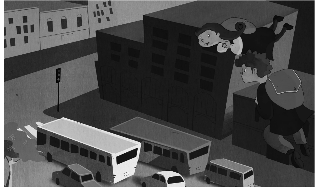
Mochilas voladoras: el nuevo medio de transporte de los estudiantes de Santiago