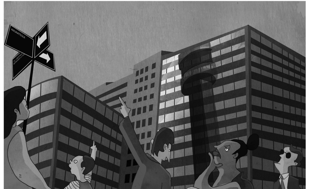
¿Y dónde está la torre Entel?