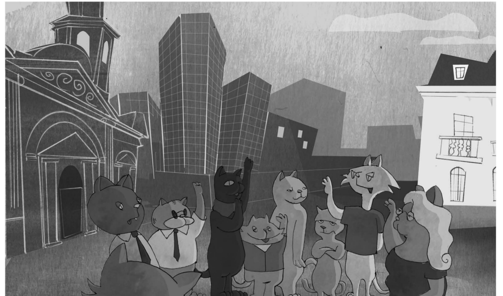
Y eso fue lo que decidieron en la reunión mensual de la Plaza de Armas